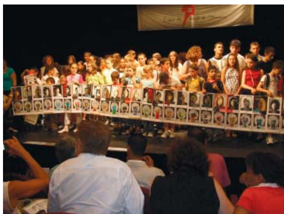
La remise des prix nationale à la Maison Molière, samedi 28 juin 2008.

une atmosphère chaleureuse, avant le somptueux goûter traditionnel (offert par le groupe Jardin Bio ) dans le beau théâtre de la Maison Molière.