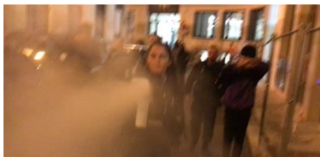
Image 4 : la police asperge copieusement la foule de gaz lacrymogène.

Loin de faire respecter le droit, la police a donc soutenu une action illégale, quitte à ce que cela la conduise - du fait de l'escalade des tensions - à utiliser la force , en pointant un LBD sur les personnes présentes, y compris l'équipe d'observation, à moins de trois mètres de distance ( image 3 ), en frappant à coups de matraque pour repousser des personnes tentant d'entrer dans l'immeuble et en aspergeant copieusement de gaz lacrymogène ( image 4 ) alors que la foule était globalement pacifique . Ce d'autant plus qu'aucune démarche d'apaisement par un rapprochement entre l'avocat du propriétaire, autorisé à passer le barrage de police, et l'avocate du collectif, qui réclamait de parler à son confrère, n'a été tentée.