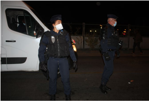
Figure 1 : photo prise à 4h50 : pont de Stains

De plus, la circulation sur le pont à ce moment n'a pas été arrêtée.