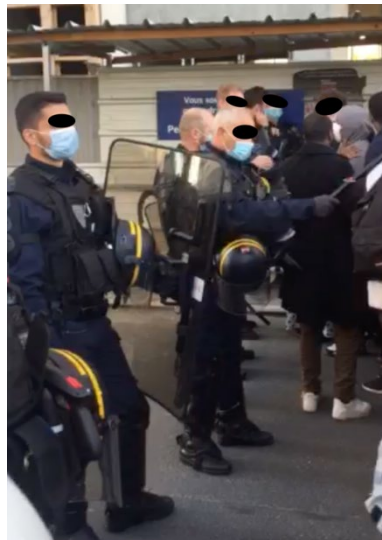
Figure 6 : photo prise à 7h34 au niveau du 96 avenue Victor Hugo

Nous pouvons constater que la méthode d'évacuation perlée vers les bus ne fonctionne pas, les FDO recourent à la force.