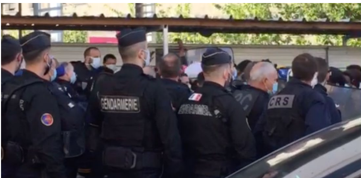
Figure 4 : photo prise à 8h56 au niveau du 96 avenue Victor Hugo

Des évacuations perlées vers les Bus seront alors organisées par les forces de l'ordre. Les personnes présentes ne pourront sortir du dispositif que pour se rendre au bus :