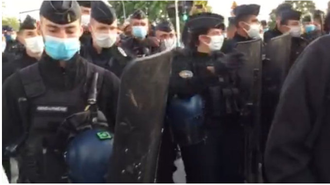
Figure 5 : photo prise à 6h32 rue Madeleine Vionnet au niveau du Canal