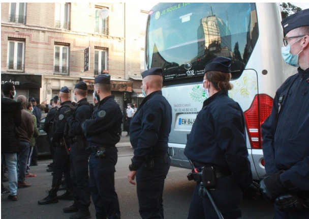
Figure 3 : photo prise à 7h25 au niveau du 96 avenue Victor Hugo

De 7h à au moins 10h00 , niveau du carrefour Victor Hugo et de la rue Madeleine Vionnet nous constatons que la place est encerclée .