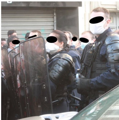
Figure 6 : Photo prise à 8h55 au niveau du 96 avenue Victor Hugo

Nous pouvons constater que la méthode d'évacuation perlée vers les bus ne fonctionne pas, les FDO recourent à la force.