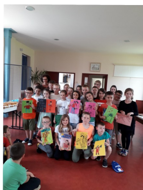
Les élèves de Nouvion avec leurs travaux

*Ecoles du Crotoy, d'Estrées-les-Crécy, Fort-Mahon, Quend, Nouvion, EREA de Berck, IME de la Baie de Somme.