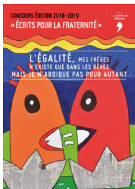
Plaquette de présentation du concours 2018-2019 disponible sur le site de la LDH nationale rubrique « concours les écrits pour la fraternité »