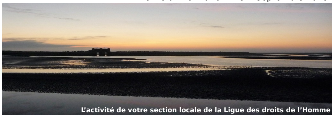
L'activité de votre section locale de la Ligue des droits de l'Homme