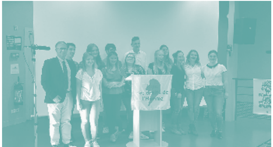
Avec la section du Crotoy-Rue, des élèves du lycée du Vimeu ont participé, pour la deuxième année, au festival des plaidoiries.

Rencontrer les jeunes, leur donner la parole est donc un enjeu important. Comme chaque année, le comité régional a relayé les informations concernant le concours des « Ecrits pour la fraternité ». Il est à noter qu'en Picardie les interventions en milieu scolaires évoluent de manière positive. En effet, de nombreuses sections sont régulièrement