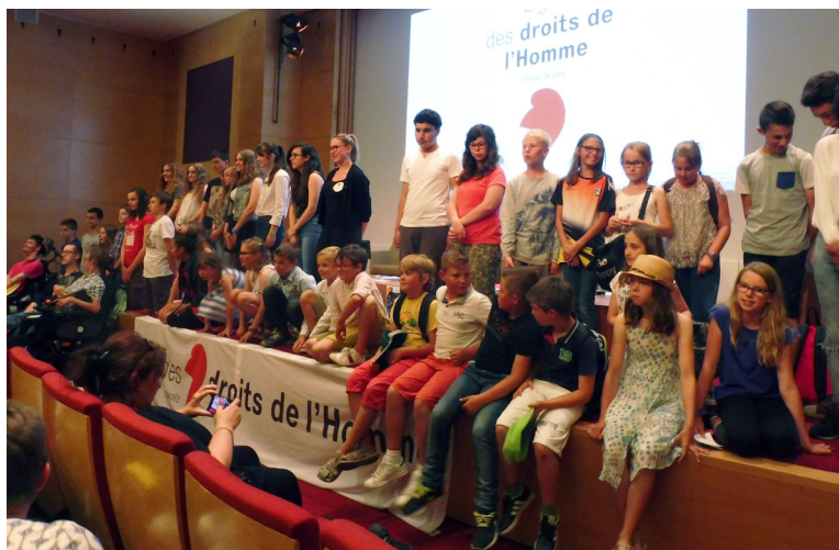
Remise de prix du samedi 17 juin 2017, grand amphithéâtre de la MGEN, Paris.

Nous vous appelons dès aujourd'hui à poursuivre cette mobilisation, à relancer cet événement et à lui donner la place qui lui revient dans votre région. Avec ce concours, la LDH affirme sa dimension pédagogique. Il nous importe que les jeunes générations soient sensibilisées aux droits de l'Homme, aux thèmes qui nous sont chers. Et pour cela, nous avons besoin de vous, de votre ambition et de votre militantisme.